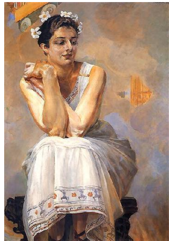
Jacek Malczewski Pytia II 1917